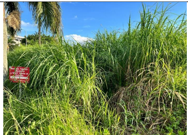
LOTE DE TERRENO