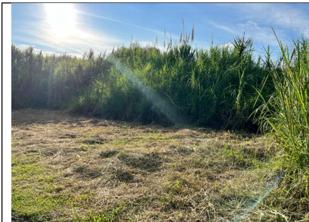
LOTE DE TERRENO