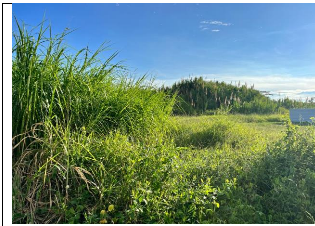
LOTE DE TERRENO