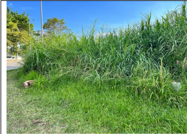
LOTE DE TERRENO