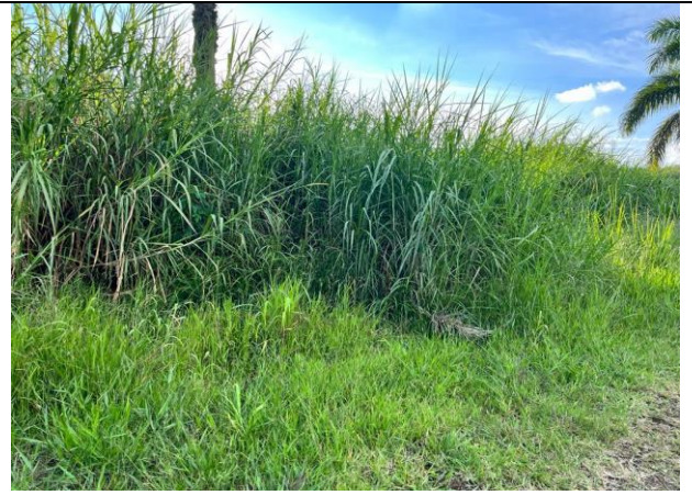
LOTE DE TERRENO