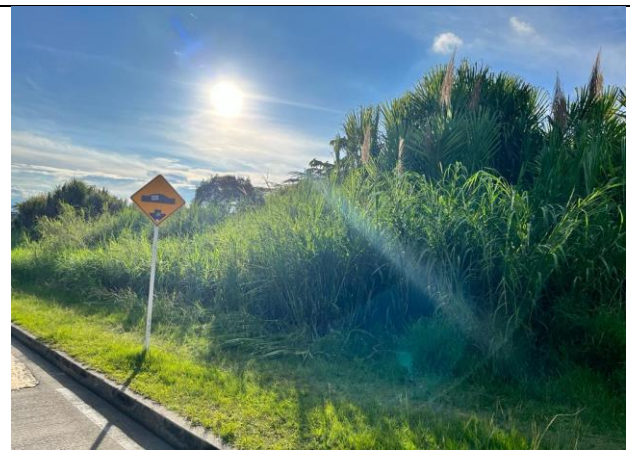
LOTE DE TERRENO